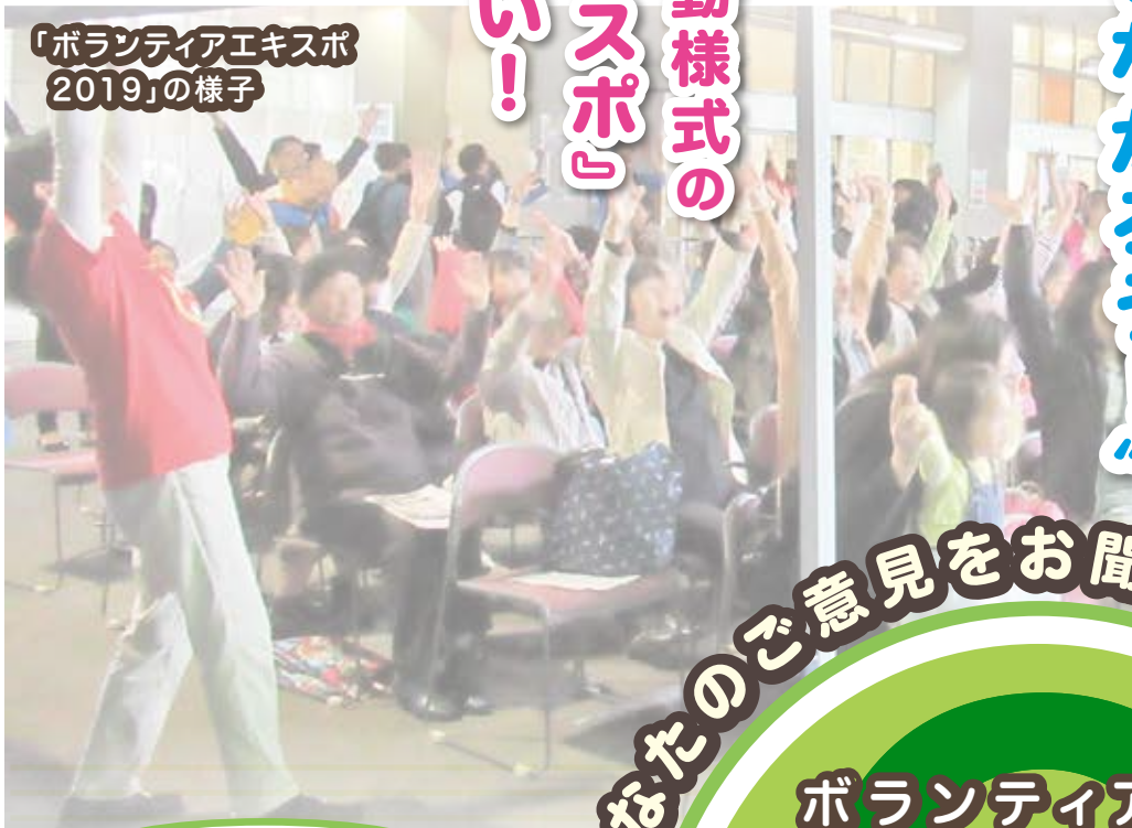
「ボランティアエキスポ2019」の様子