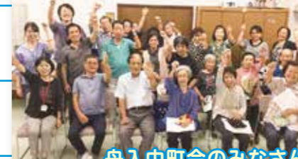
舟入中町会のみなさん

●内容...認知症の正しい知識・理解・対応について (②は施設体験つき) ●定員...20名 ●申込...電話・ファックス・直接来館で ●締切...開催前日まで 主催:西淀川区キャラバン・メイト連絡会 問 地域支援担当 ☎6478-2941 ☎6478-2945