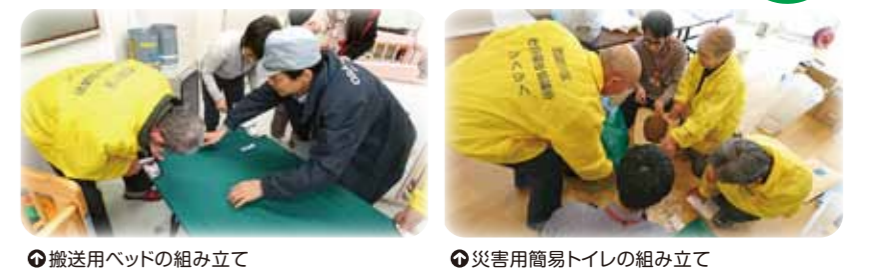
◎搬送用ベッドの組み立て